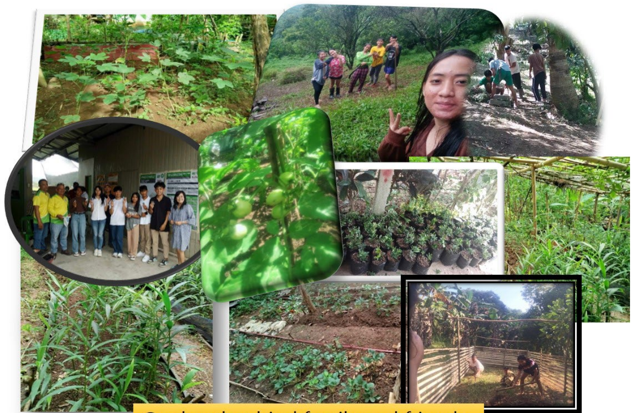
Garden that bind family and friends

Viele SchülerInnen auf den Philippinen brechen ihre Schule ohne Abschluss ab, aus finanziellen Gründen oder weil sie nicht vom Land in eine Stadt ziehen können. Ein ganzheitliches Projekt von Youth Development Activity – Go Viral versucht, Jugendliche vor diesem Schicksal zu bewahren, indem es sie bei der Ausbildung und dem Pendeln zur Schule unterstützt und ihnen wichtige Fähigkeiten vermittelt, die in der Schule nicht genügend berücksichtigt werden. Die Support Group ermöglichte die Anschaffung von mehreren Computern und einer stabilen Stromversorgung (über Fotovoltaik), um den Jugendlichen Zugang zum Internet zu ermöglichen sowie den Erwerb wichtiger Computerkenntnisse. Des weiteren unterstützte die Support Group die Einrichtung eines Gemüsebaukurses, damit sich junge Erwachsene und deren Familien besser ernähren können.