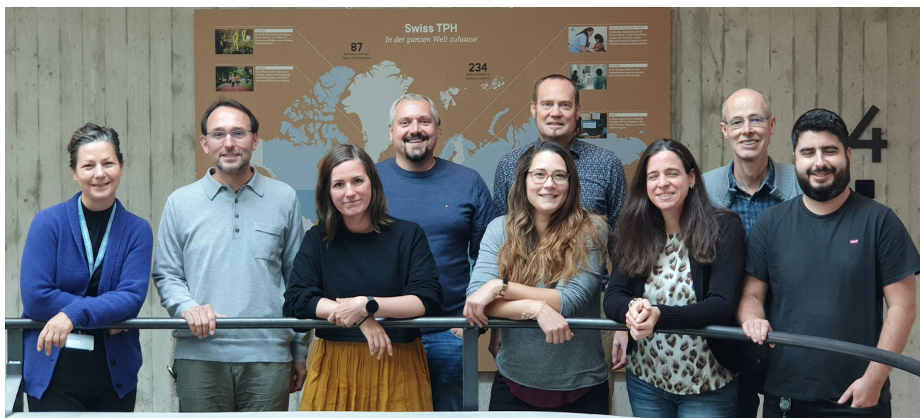
Vorstand der Support Group (17. Oktober 2023)

Präsident der Support Group am Swiss TPH